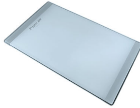
Tagliere in cristallo 8631 300